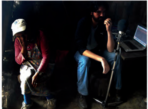
Equipo recopilando ül en alrededores del lago Budi